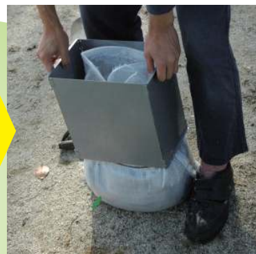
③どのサポを引き上げるだけ！

ひとりで土のうをかんたんにつくることが可能に！ さらにケガや負担も大幅に減り、作業効率 UP!!